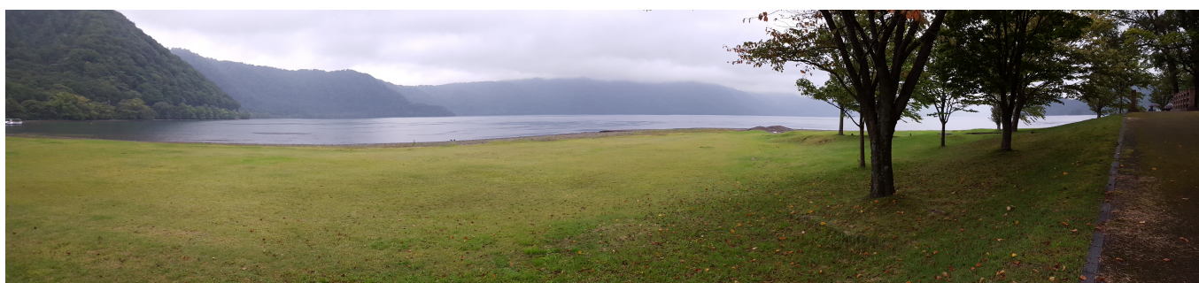
La grisaille ne faiblit pas. Le « Towakado Lake View Hôtel » qui nous accueille semble